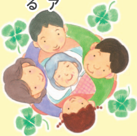
医療福祉・在宅看取りの地域創造会議