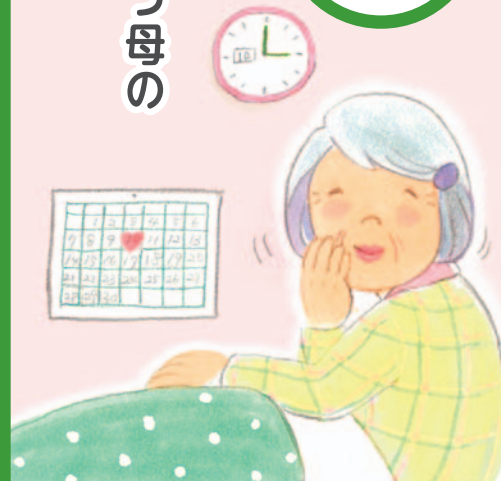
医療福祉・在宅看取りの地域創造会議