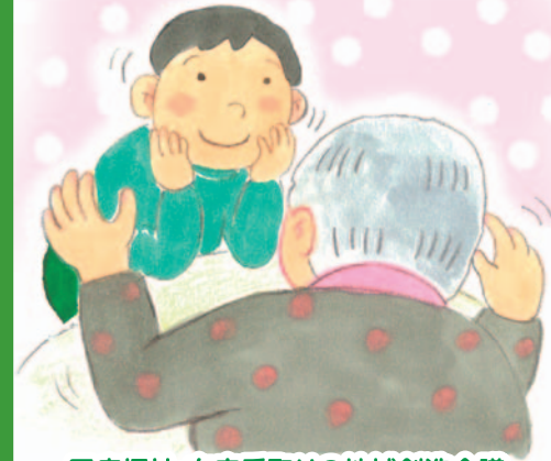
医療福祉・在宅看取りの地域創造会議