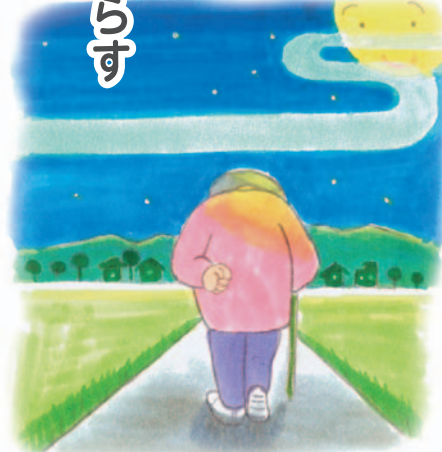
医療福祉・在宅看取りの地域創造会議