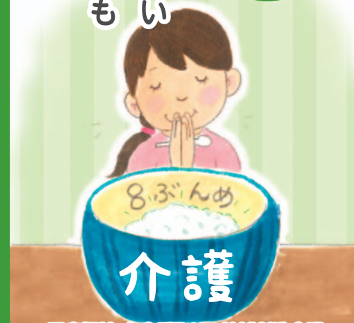
医療福祉・在宅看取りの地域創造会議