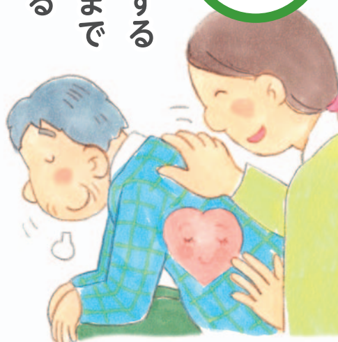
医療福祉・在宅看取りの地域創造会議