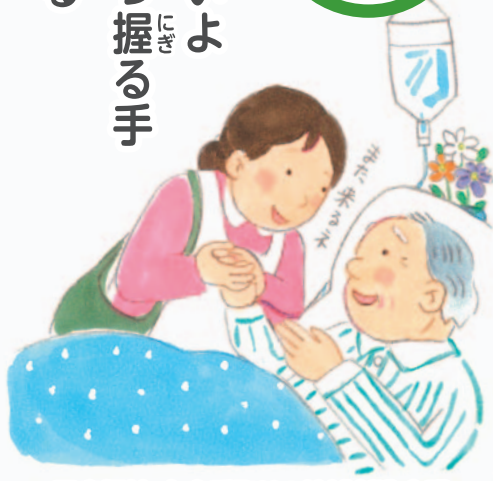
医療福祉・在宅看取りの地域創造会議