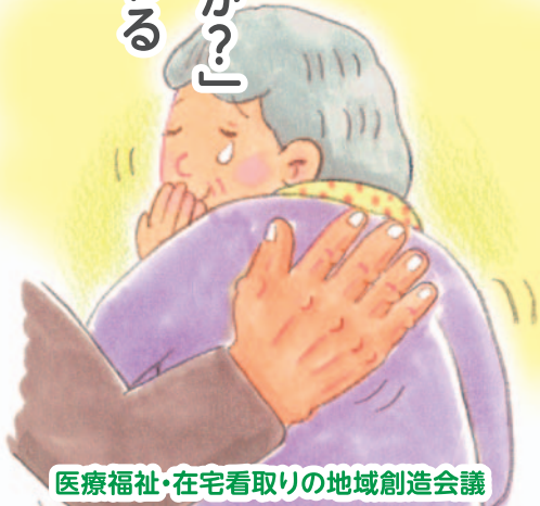
医療福祉・在宅看取りの地域創造会議