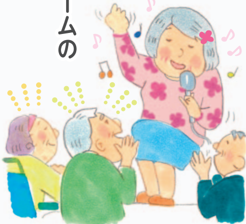
医療福祉・在宅看取りの地域創造会議