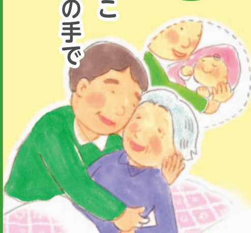
医療福祉・在宅看取りの地域創造会議