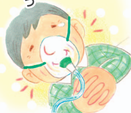
医療福祉・在宅看取りの地域創造会議