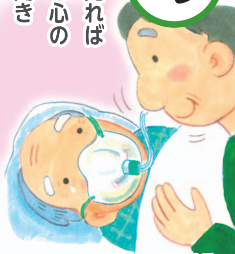
医療福祉・在宅看取りの地域創造会議