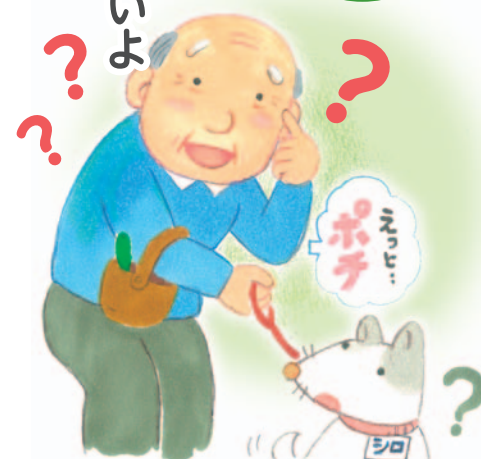
医療福祉・在宅看取りの地域創造会議