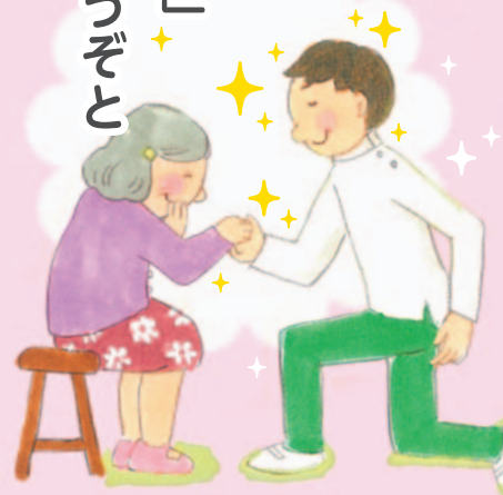
医療福祉・在宅看取りの地域創造会議