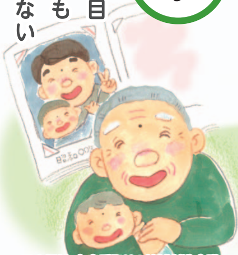
医療福祉・在宅看取りの地域創造会議