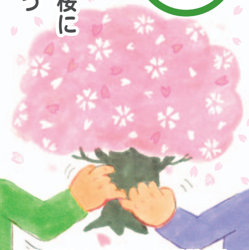
医療福祉・在宅看取りの地域創造会議