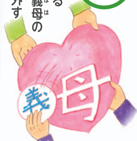
医療福祉・在宅看取りの地域創造会議