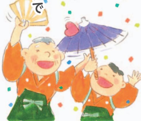
医療福祉・在宅看取りの地域創造会議