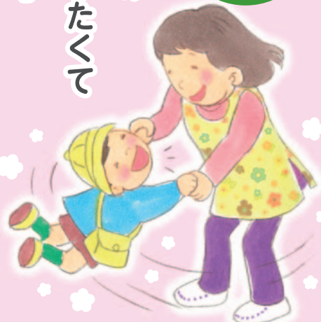
医療福祉・在宅看取りの地域創造会議