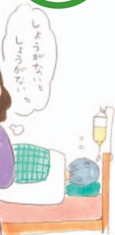
医療福祉・在宅看取りの地域創造会議