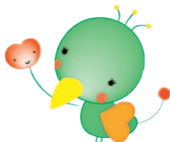
みとりちゃん HIROMI.W 医療福祉・在宅看取り啓発キャラクター

誰もが地域で 自分らしく暮らし続け 老いを迎え 平穏に死を迎えられる 社会をめざして