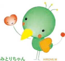
みとりちゃん HIROMI W 医療福祉・在宅看取り啓発キャラクター

どのような状況になっても 「自分らしく暮らし続ける」ことや 「楽しく生ききる」ことを 皆で支える地域社会の 創造をめざして活動しています